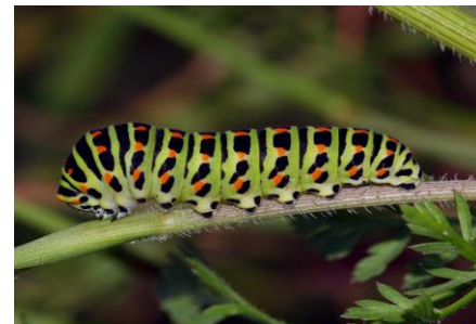
Schwalbenschwanz ( Papilio machaon )