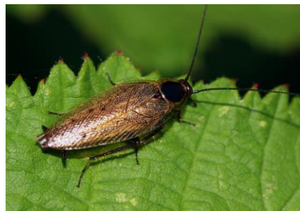
Gemeine Waldschabe ( Ectobius lapponicus )