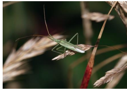
Langhorn ( Megaloceroea recticornis )