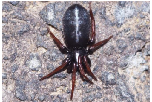
Plattbauchspinne ( Trachyzelotes pedestris )