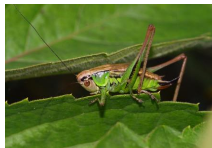
Roesels Beißschrecke ( Metrioptera roeselii )