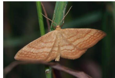
Ockerfarbiger Steppenheiden-Zwergspanner ( Idaea ochrata )