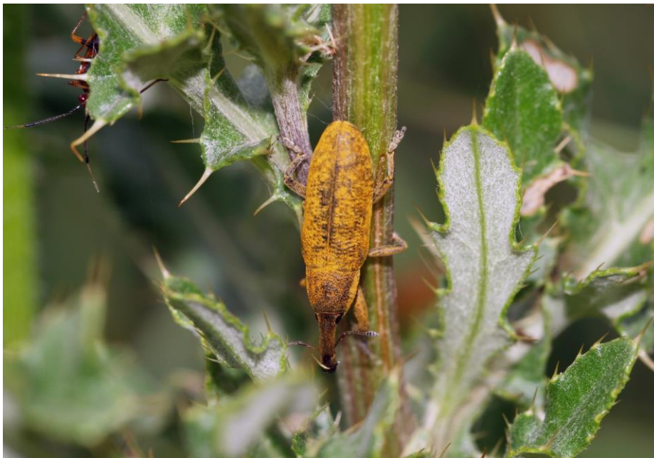
Sumpfrüssler ( Lixus angustatus )