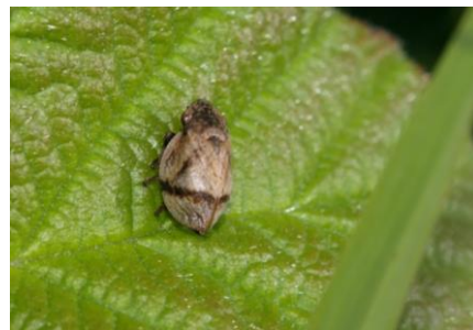
Wanst-Schaumzikade ( Lepyronia coleoprata )