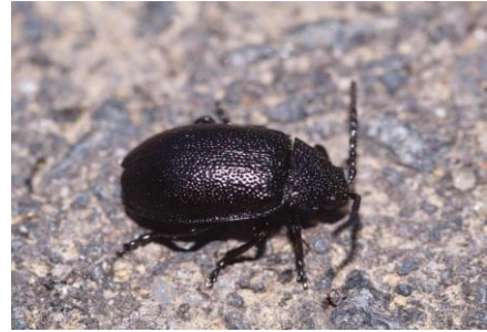
Rainfarn-Blattkäfer ( Galeruca tanacetii )