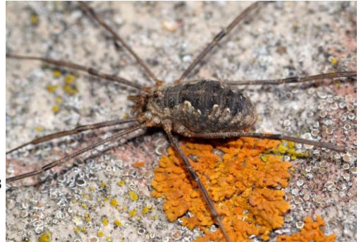
Weberknecht ( Phalangium opilio ) mit diversen Flechten